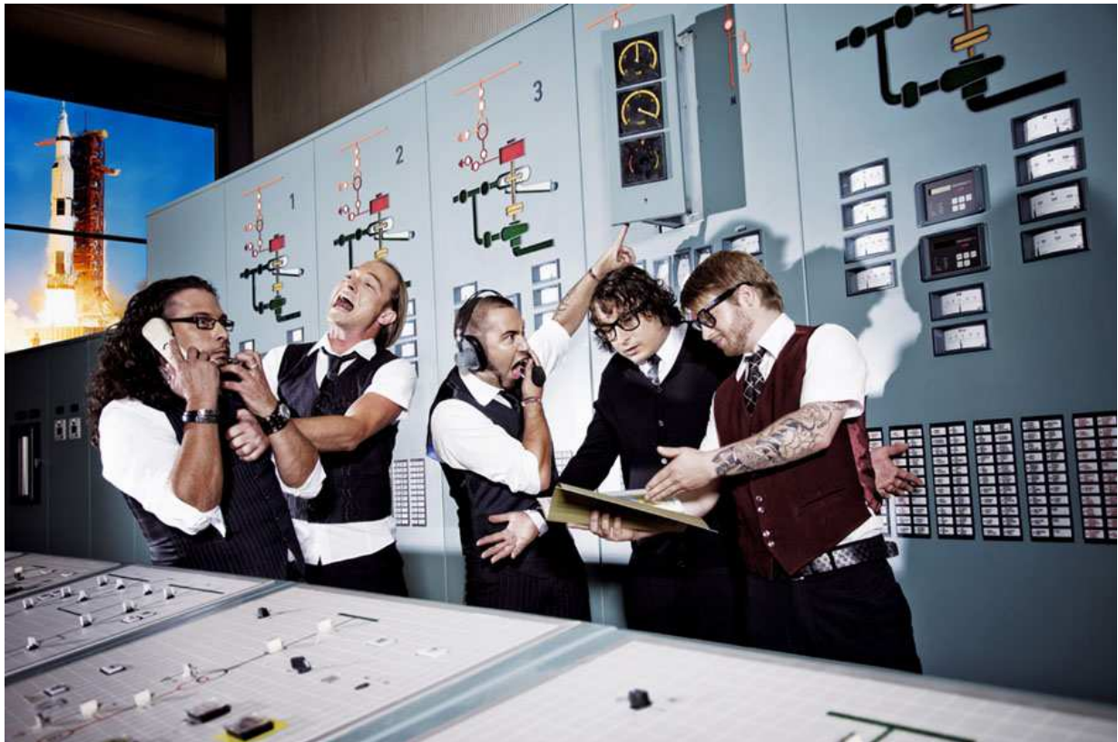
Abbildung: Band pic – take off

Kontakte pflegt TFOA auch zu Marque (Marcus Nigsch).